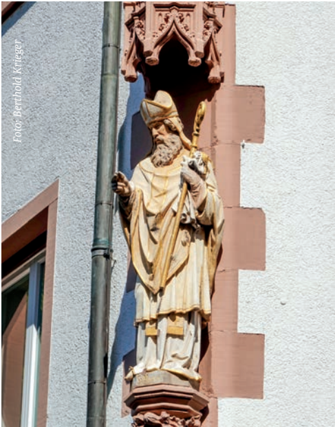
Der Heilige Martin mit segensreichem Blick auf den Freiburger Rathausplatz.

Sulzbürger Str. 18 79114 Freiburg 0761 4 90 78-0 pfarrbuero.st.andreas@ kath-freiburg-suedwest.de Mo, Fr: 15.00 – 17.30 Uhr Di, Do: 9.00 – 12.00 Uhr (in den Schulferienzeiten eventuell abweichend)